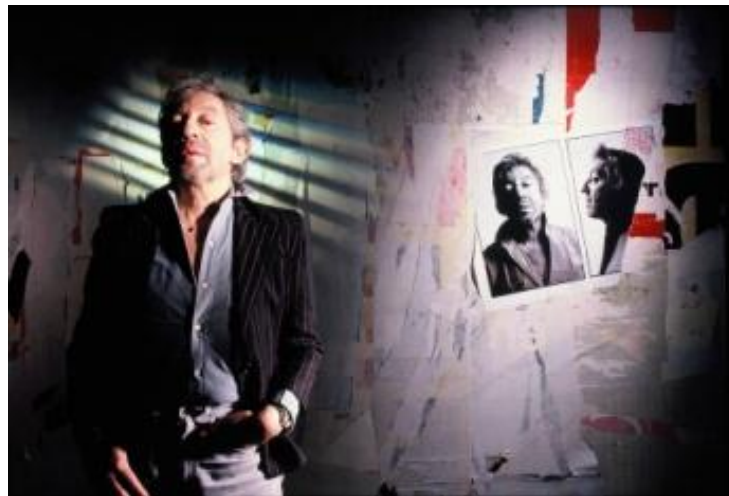
Pierre TERRASSON – You're under arrest, 1989 , Tirage ciba 50 x 60 cm.