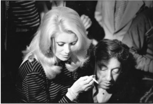
Martine PECCOUX - "Deneuve- Gainsbourg" le fumeur de Havane . Paris 1980. Tirage argentique sur papier baryté de format 30x40