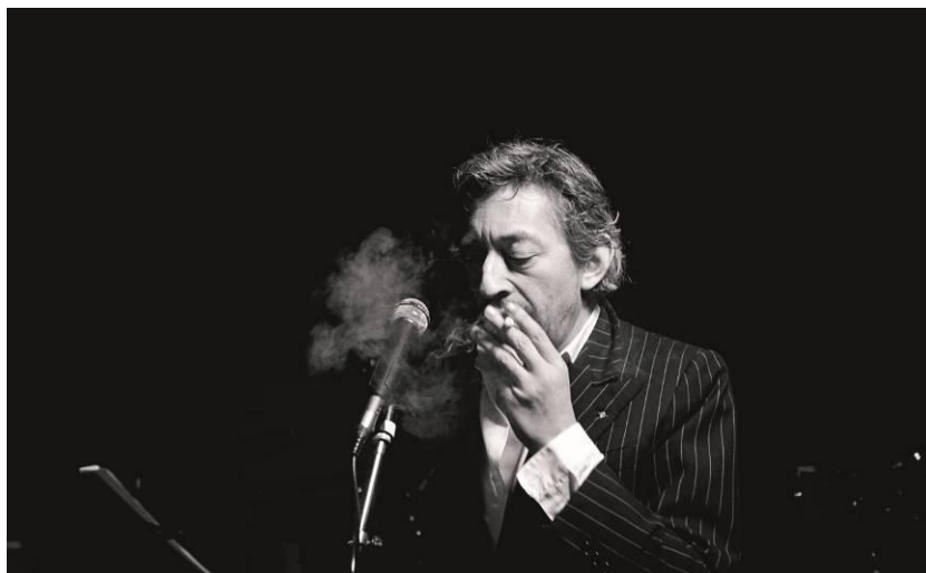
Serge Gainsbourg, 1979, tirage baryté noir et blanc.